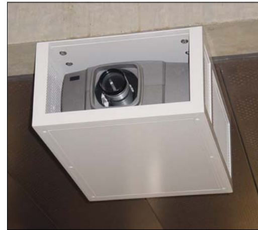
Beameranlage im Innenhof des Hauptgebäudes wird bei speziellen Anlässen z.B. zum Abspielen von Filmen eingesetzt.

Marco Polo fasst die Gründe, die zum Entscheid pro VisiWeb führten, zusammen: «Ruf konnte bereits Erfahrungen in diesem relativ jungen Markt vorweisen. Zudem wählten wir mit der Firma Ruf ein Generalunternehmen, das alles aus einer Hand liefern kann. Für uns war es wichtig, dass wir auf eine schlüsselfertige Lösung zählen konnten. Das gelieferte Anzeigesystem VisiWeb ist technologisch auf dem neuesten Stand, flexibel und jederzeit ausbaubar. Zudem wurden kundenspezifische Anpassungen in Bezug auf Darstellung und Zugriff auf die Datenbank durch die Entwickler von Ruf innerhalb kurzer Zeit vorgenommen».