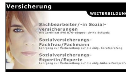
Neues Angebot in der Erwachsenenbildung