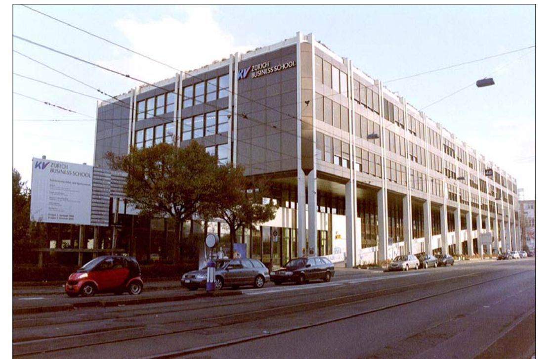
Hauptgebäude der KV Zürich Business School an der Limmatstrasse in Zürich.