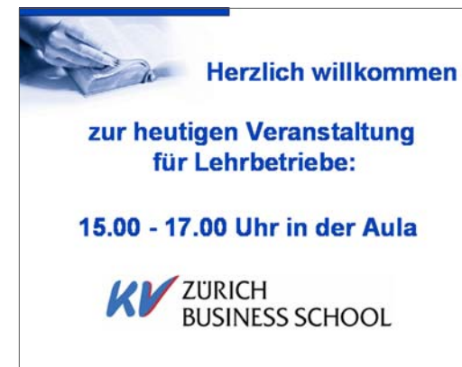
Ankündigung Informationsveranstaltung in der Aula