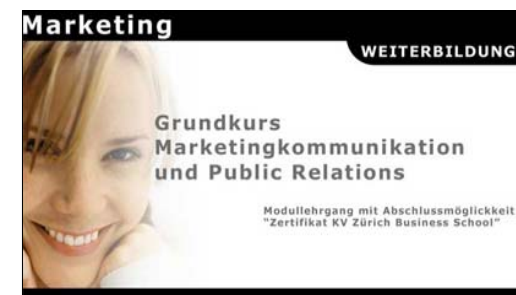
Werbung in eigener Sache