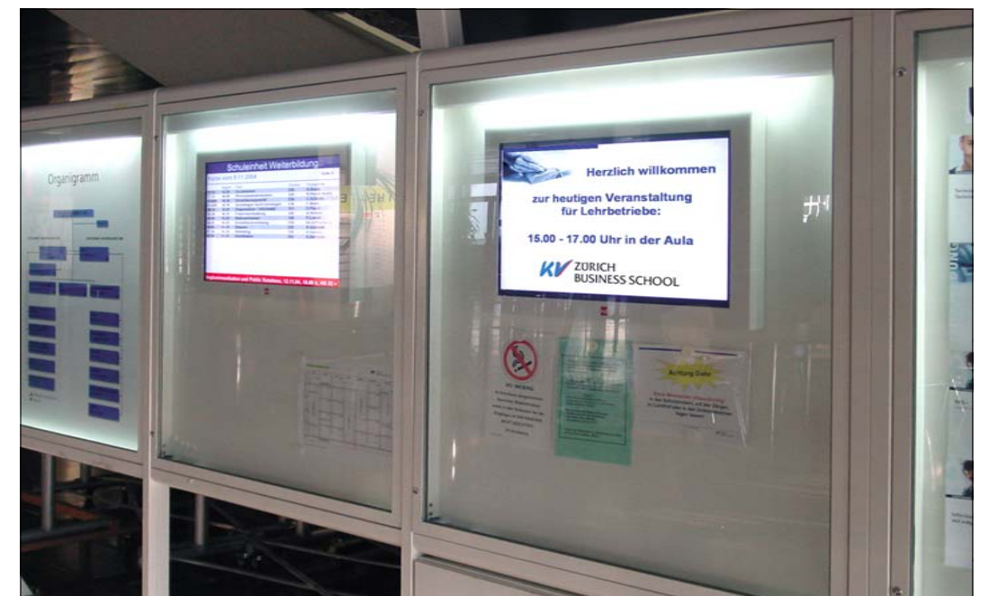
In Schaukasten integrierte TFT-Anzeigen erlauben eine vereinfachte und schnelle Aktualisierung der Inhalte.

«Generell ist die Bedienung des Systems sehr benutzerfreundlich und die Inhalte können attraktiv dargestellt werden». Marco Polo sieht den grössten Nutzen des Systems darin, die Informationen einem breiten Publikum zugänglich zu machen und diese zeitgerecht und kurzfristig zu verbreiten. Die Aktualisierung der Daten findet an zentraler Stelle im Hauptgebäude an der Limmatstrasse statt. Von da aus werden sie über das interne Firmennetzwerk an die Anzeigen in den Gebäuden Puls 5 und an der Heinrichstrasse übermittelt. «Wir setzen die Anzeigen immer paarweise ein. So sind jeweils auf einer Seite Informationen für die Besucher der Grundschule und auf der anderen diejenigen für die Erwachsenenbildung. Seit der Implementation von VisiWeb vor rund zwei Jahren ist es für die Kursteilnehmer zur Selbstverständlichkeit geworden, die Informationen auf diesem Weg zu erhalten. Wir stellen fest, dass seit der Aufschaltung des Anzeigesystems unser Auskunftssekretariat rund 70% weniger angefragt wurde».