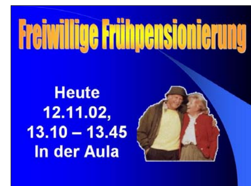
Inhalte werden mit PowerPoint schnell aufbereitet