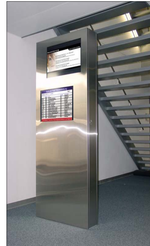
Stele aus rostfreiem Stahl neben dem Eingang im Puls 5 Gebäude.